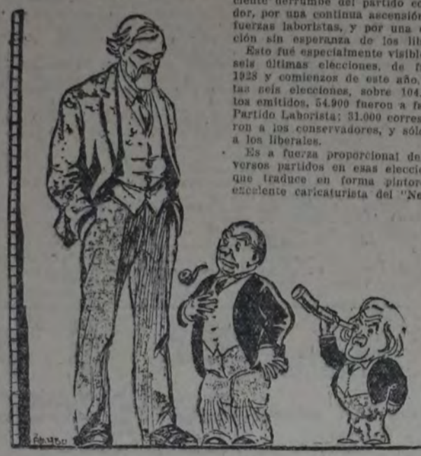
ESTE DIBUJO EXPRESA LA FUERZA PROPORCIONAL DE LOS PARTIDOS LABORISTA, CONSERVADOR Y LIBERAL EN LAS RECIENTES ELECCIONES COMPLEMENTARIAS DE INGLATERRA: ascensión de los laboristas, derrumbe de los conservadores y estagnación de los liberales.