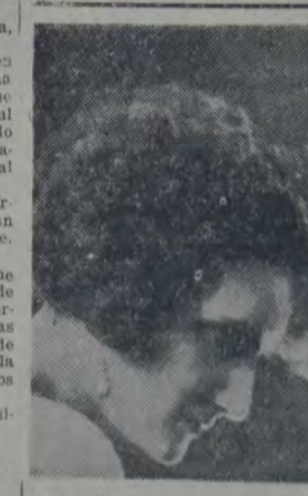
LA PRIMERA ACTRIZ ESPAÑOLA que anoche debutó en el teatro Maipo.